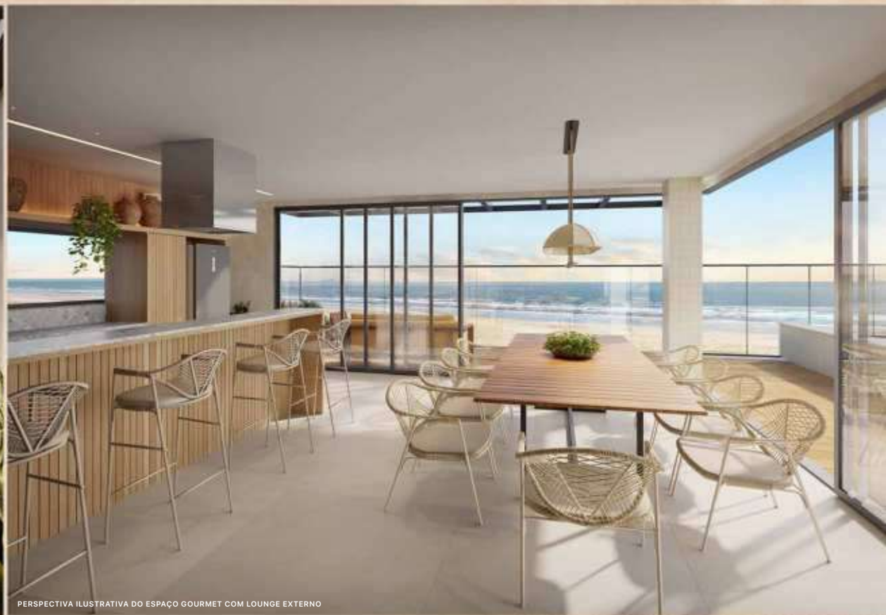
PERSPECTIVA ILUSTRATIVA DO ESPAÇO GOURMET COM LOUNGE EXTERNO