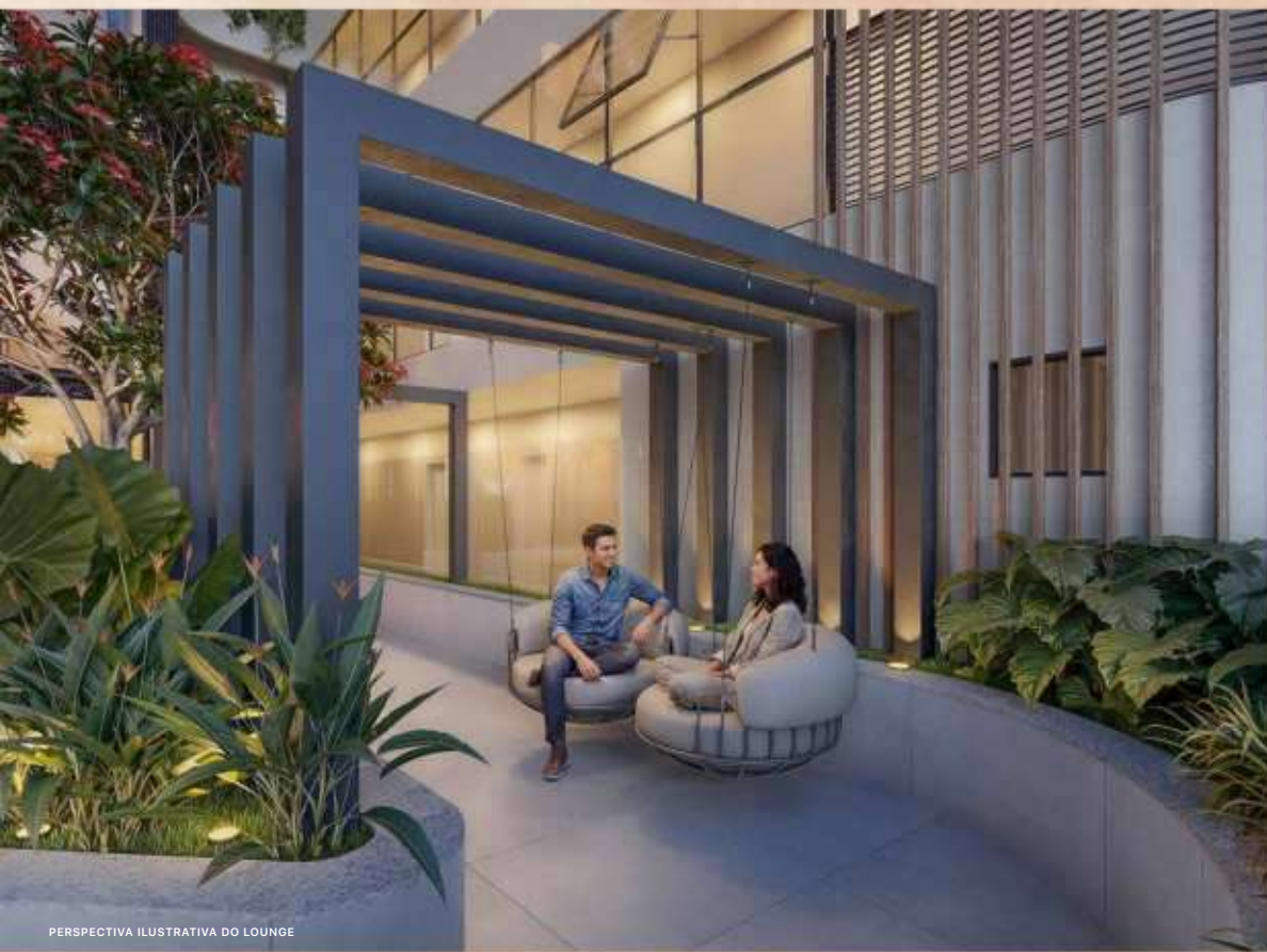
PERSPECTIVA ILUSTRATIVA DO LOUNGE