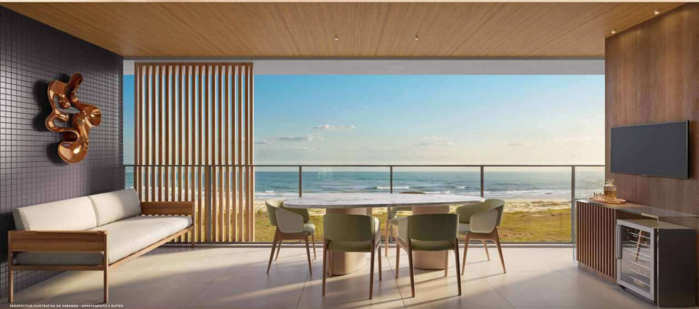
PERSPECTIVA ILUSTRATIVA DA VARANDA - APARTAMENTO 2 SUITES