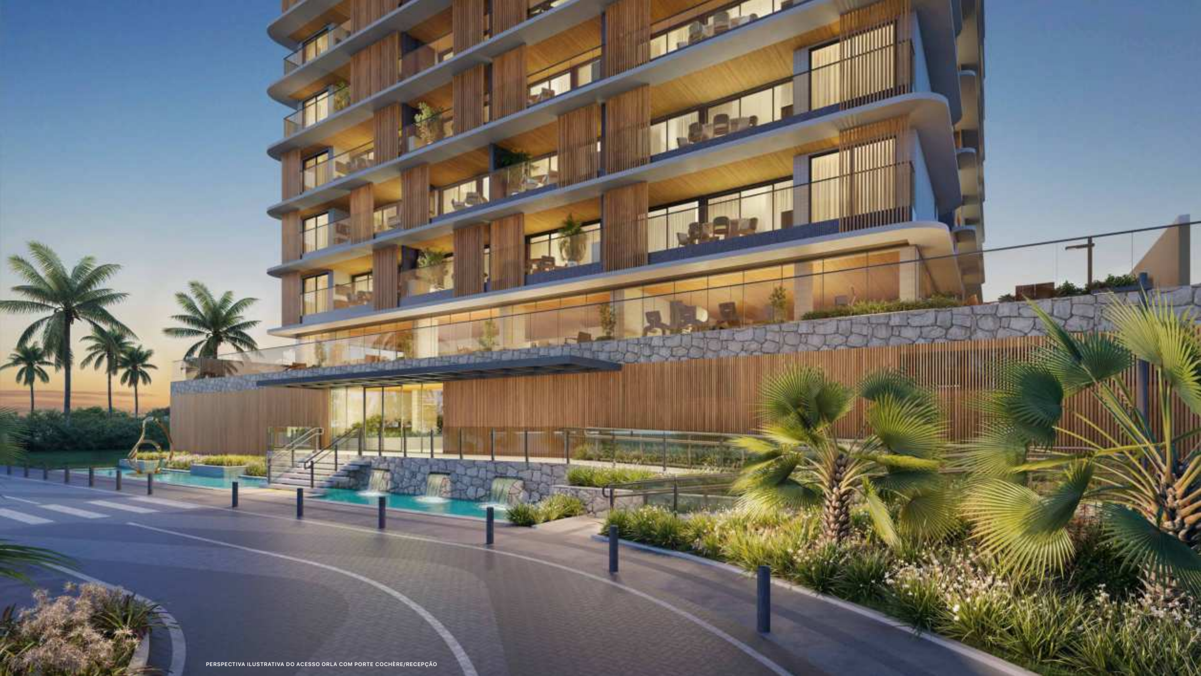
PERSPECTIVA ILUSTRATIVA DO ACESSO ORLA COM PORTE COCHÈRE/RECEPÇÃO