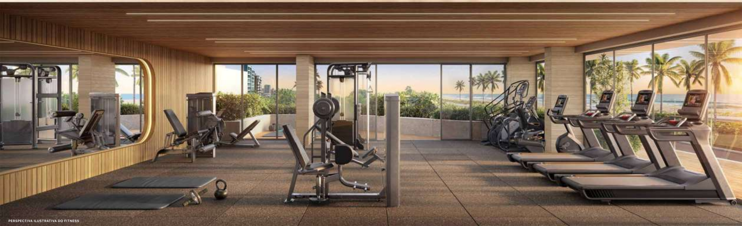
PERSPECTIVA ILUSTRATIVA DO FITNESS