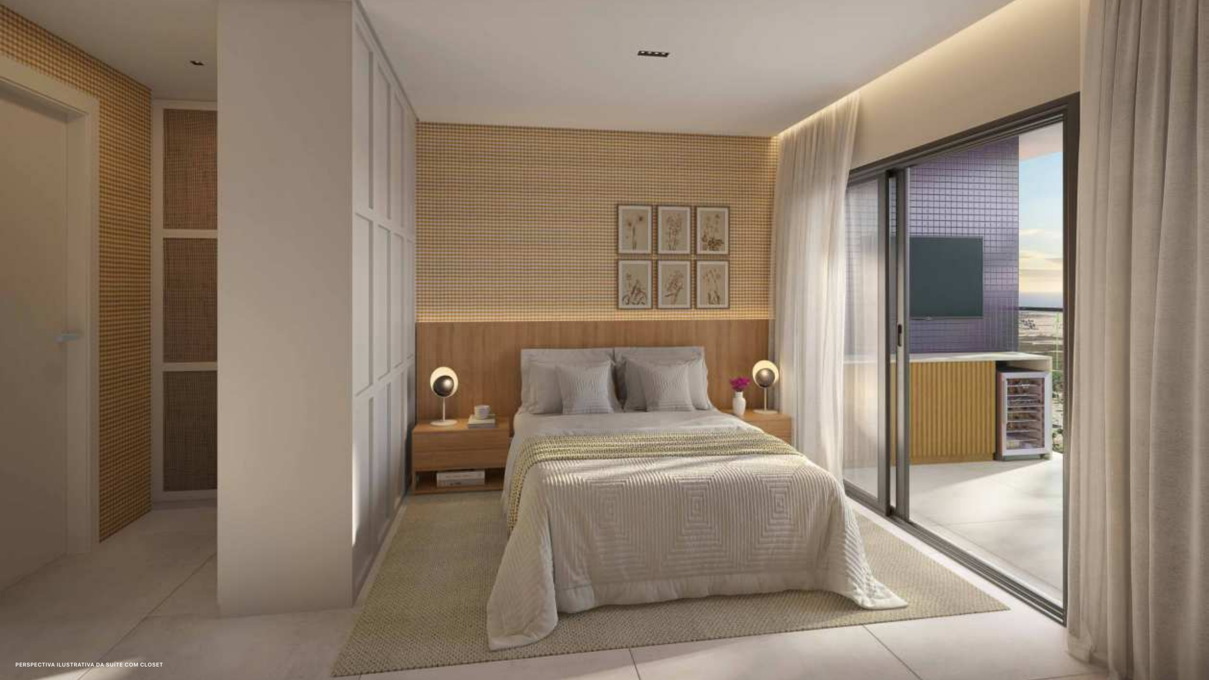
PERSPECTIVA ILUSTRATIVA DA SUÍTE COM CLOSET