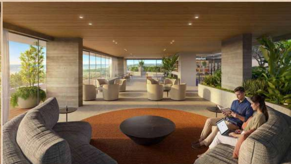
PERSPECTIVAS ILUSTRATIVAS DOS LOUNGES