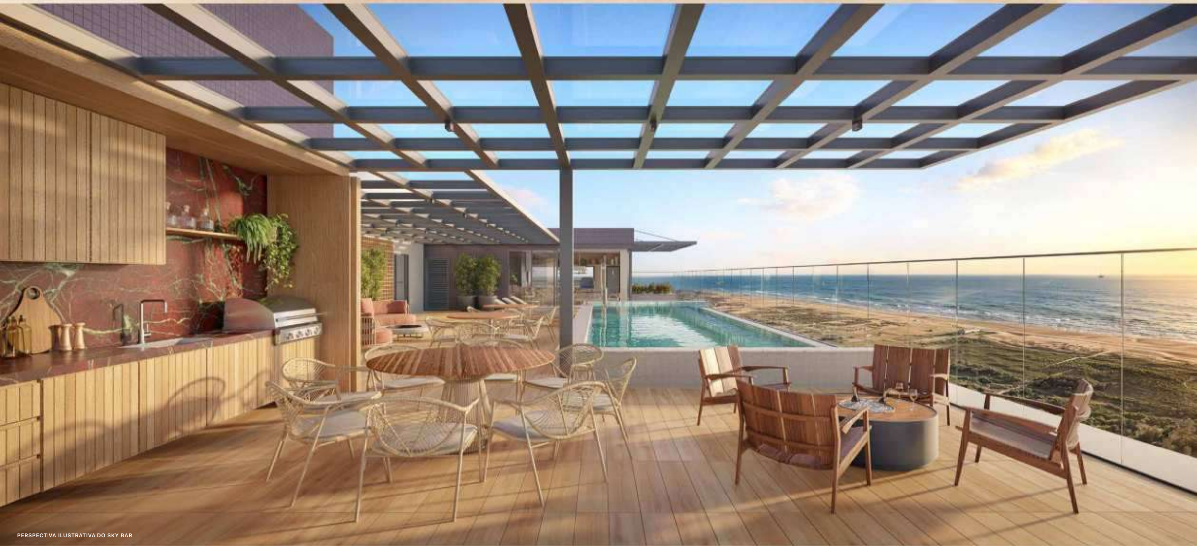
PERSPECTIVA ILUSTRATIVA DO SKY BAR