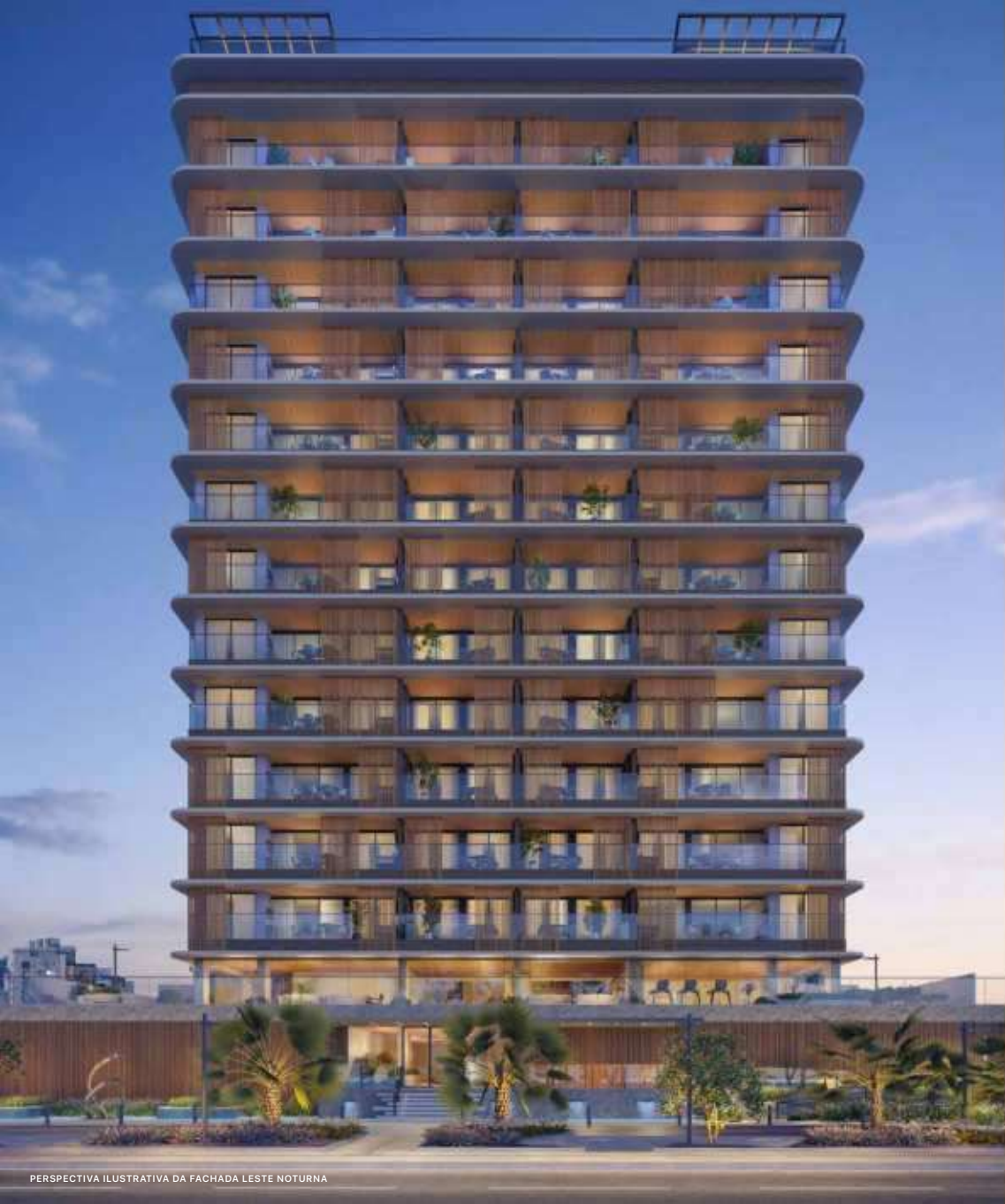
PERSPECTIVA ILUSTRATIVA DA FACHADA LESTE NOTURNA