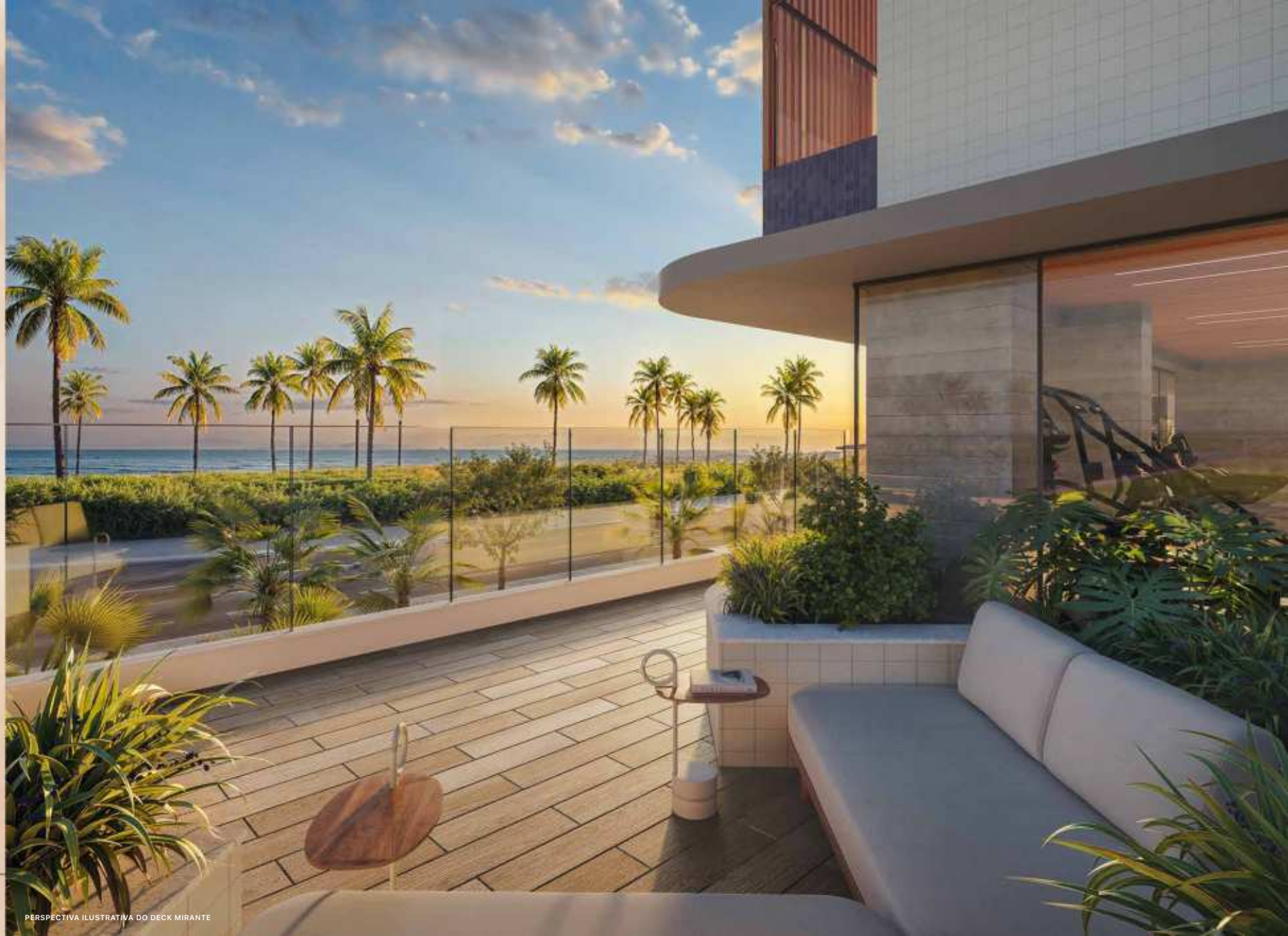
PERSPECTIVA ILUSTRATIVA DO DECK MIRANTE

MAIS DO QUE VER O MAR, VIVER COM ELE. UM NOVO PONTO DE VISTA SOBRE VIVER BEM.