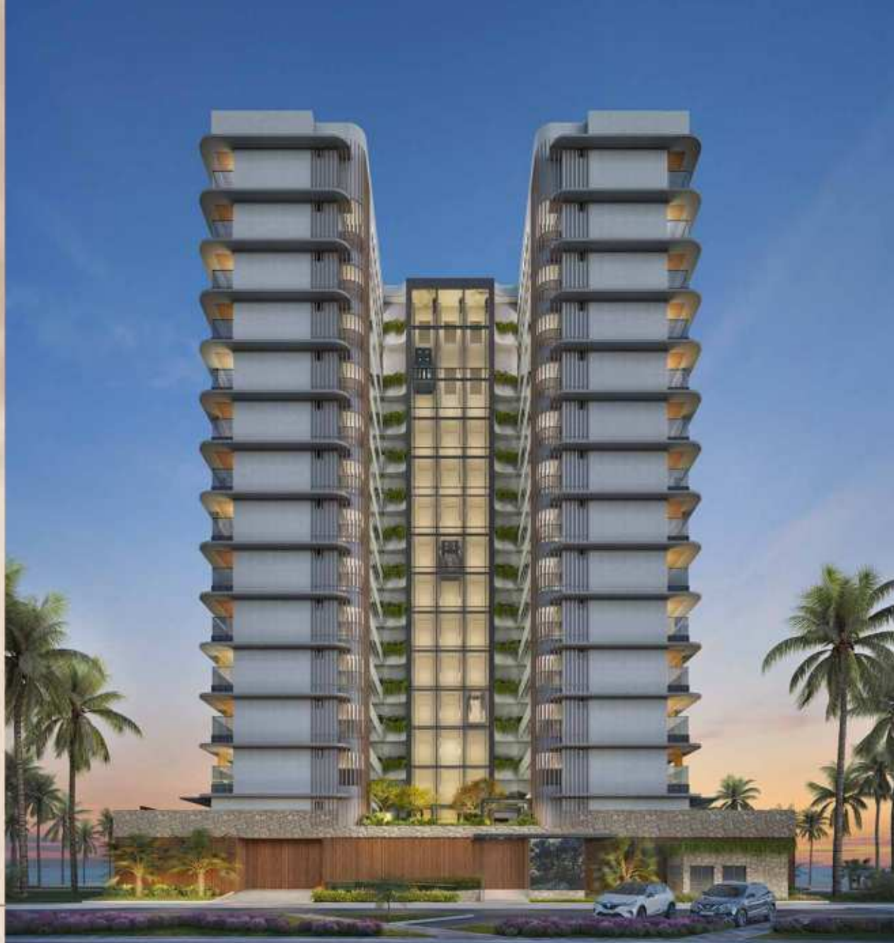
PERSPECTIVA ILUSTRATIVA DA FACHADA PRAÇA RESERVA PARQUE DOS COQUEIROS