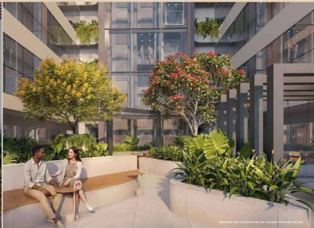
PERSPECTIVA ILUSTRATIVA DO LOUNGE POR PÓR DO SOL