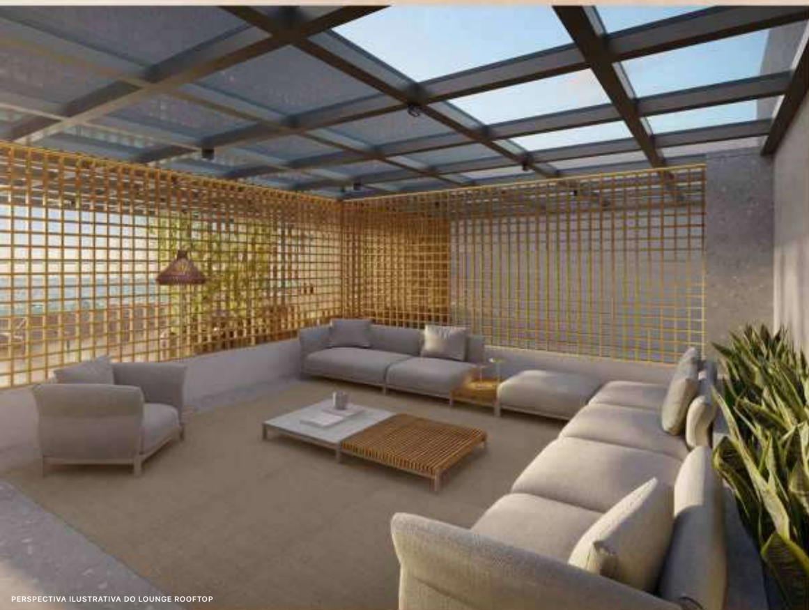
PERSPECTIVA ILUSTRATIVA DO LOUNGE ROOFTOP