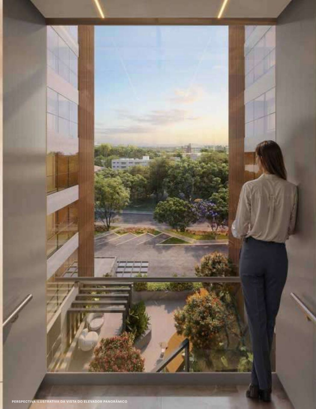
PERSPECTIVA ILUSTRATIVA DA VISTA DO ELEVADOR PANORÂMICO