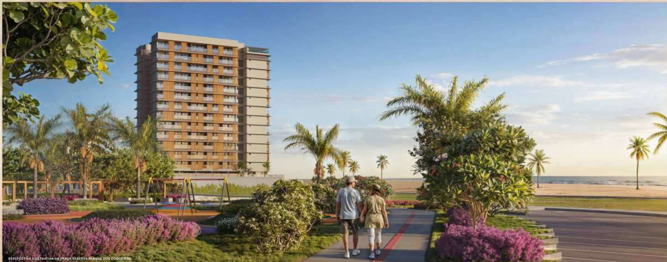
PERSPECTIVA ILUSTRATIVA DA PRAÇA RESERVA PARQUE DOS COQUEIROS