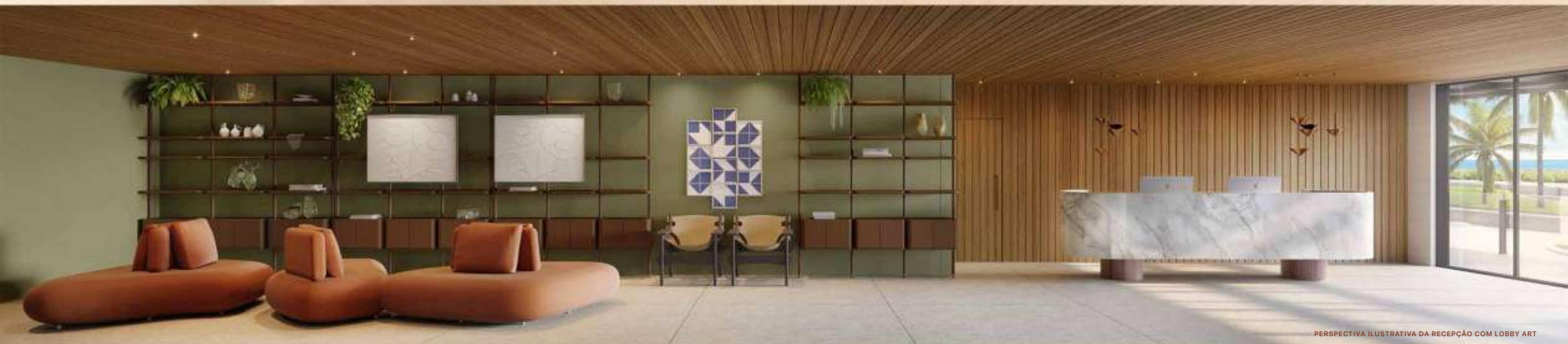
PERSPECTIVA ILUSTRATIVA DA RECEPÇÃO COM LOBBY ART